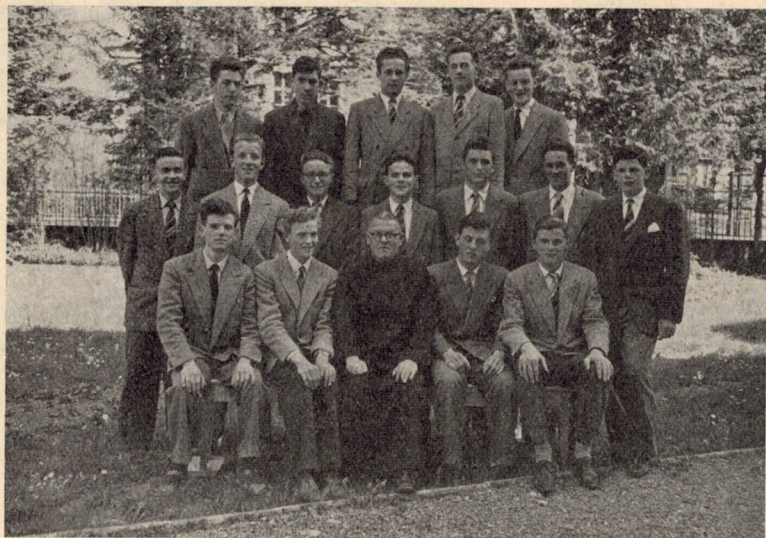
Unsere Diplomanden 1957